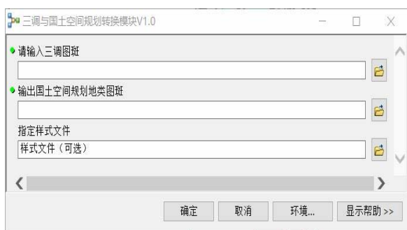
图1 国土空间规划三调基数转换功能模块及工具交互窗口

通过梳理国土空间规划分区分类与“三调”地类的关系,编制用途分类转换代码,将其植入模型构建器,同时在其中定义国土空间规划样式表,封装形成三调与国土空间规划转换模块(图1),最终实现国土空间规划底图底数的自动和快速的基数转换和可视化。