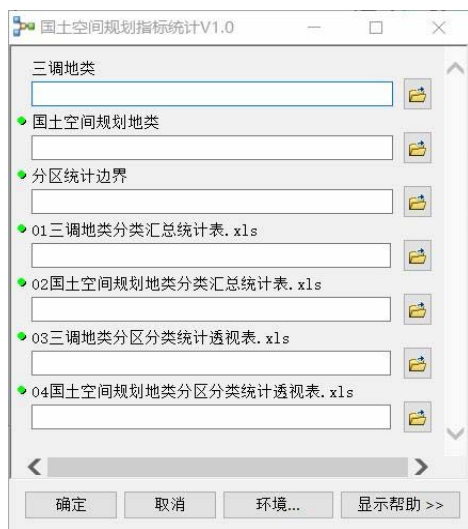
图2 国土空间规划数据统计分析功能模块及工具交互窗口

“双评价”的各类算法工作流,并构建了相应的算法模型,封装形成一套系统的“双评价”模型工具包,从而改善了“双评价”工作的效率和可靠性。