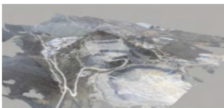
图2 高分辨率倾斜三维立体模型